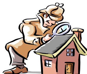
Vi gir Kjøper- og selgergaranti på vår flyttevask

Uansett hvilken løsning du velger kan vi bistå med hele eller deler av løsningen. Våre folk har over 17 år i bransjen. Be om referanser i ditt nærmiljø.